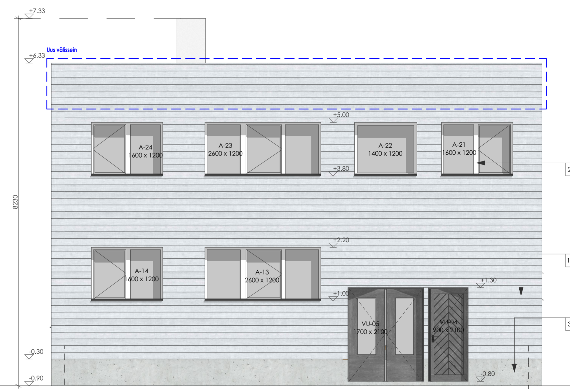
Vaade II 1:50