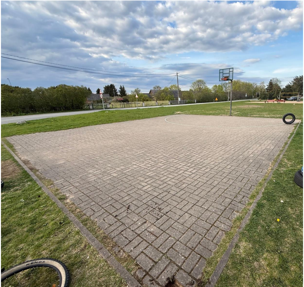
Joonis 3. Olemasolev plats.