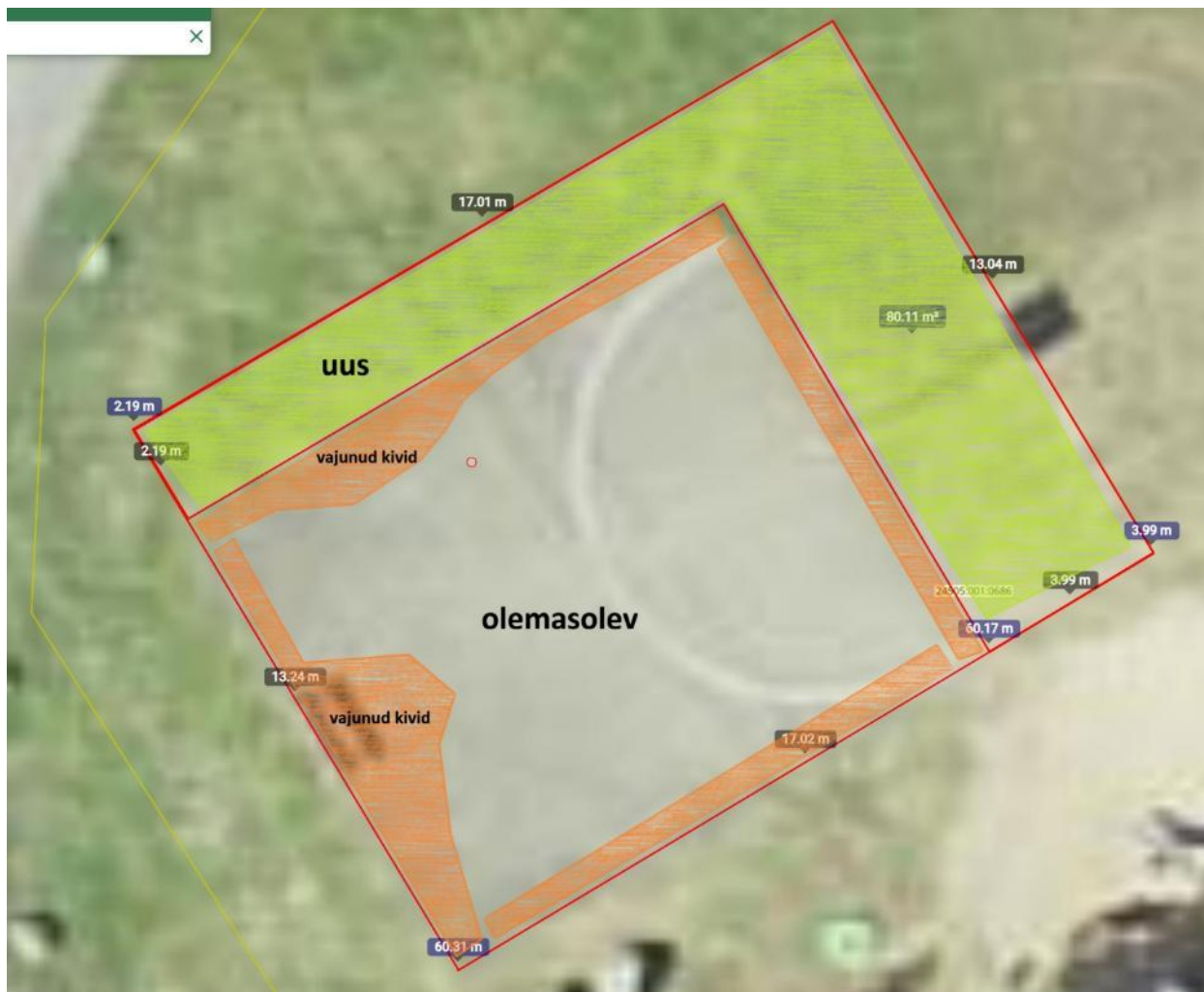
Joonis 1. Olemasoleva platsi suurendamine.