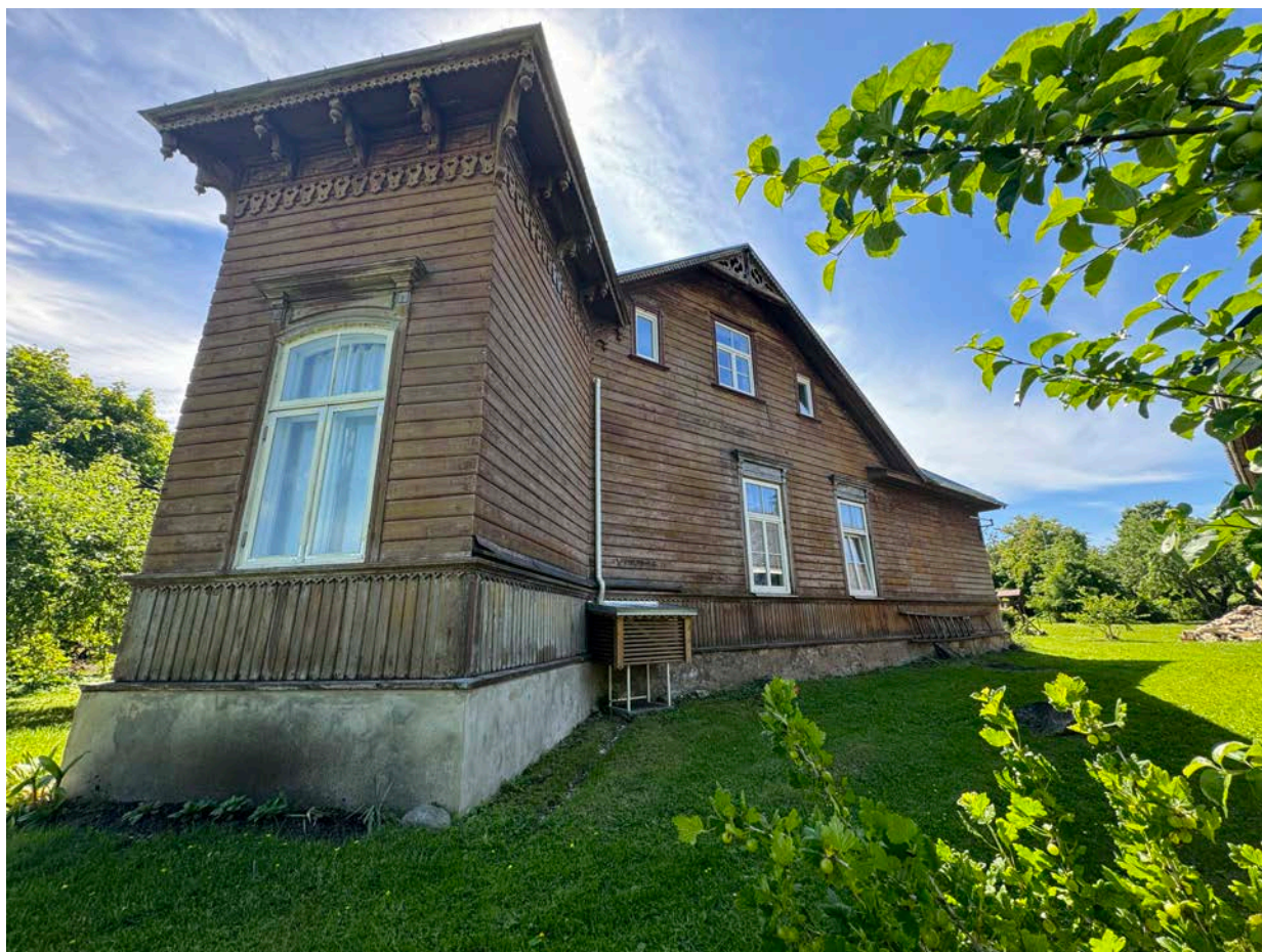
8. Hoone põhjapoolne fassaad