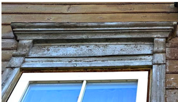
Akna piirdeliistud ja puitkarniis hoone lõunaküljelt

Vintskapile lisada räästa äärde puitdekoor, vintskapi nurgaliistud asendada laiematega.