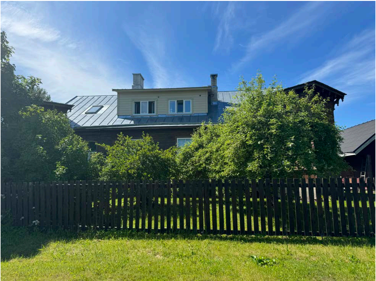
6. vaade kirdenurgast.