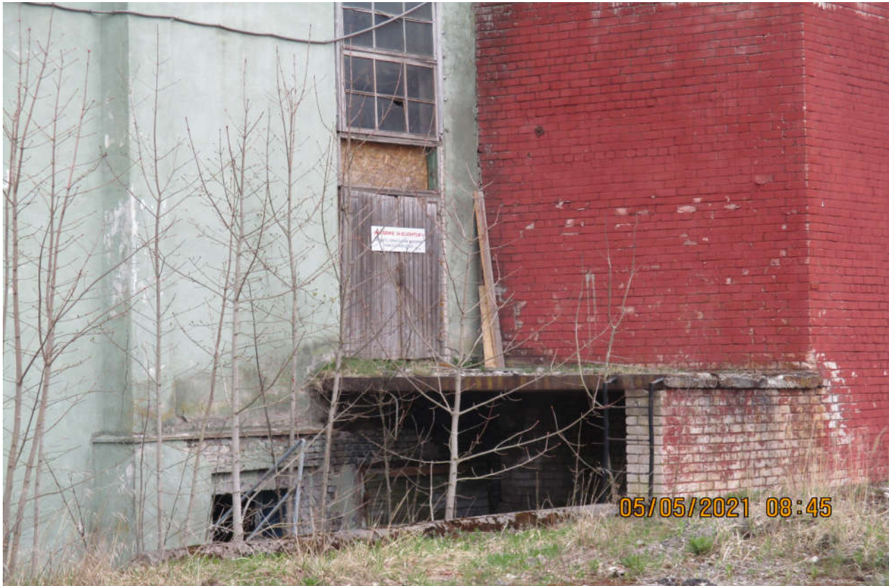
Foto 2. Sissepääs ruumi IV koos platvormiga Katlamaja hoone idafassaadil