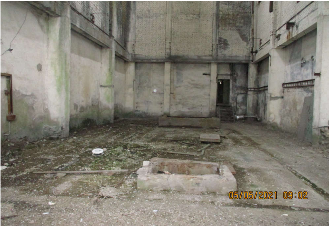
Foto 3. Ruumi IV põrand (vaade läände ruumi V poole) koos avaustega