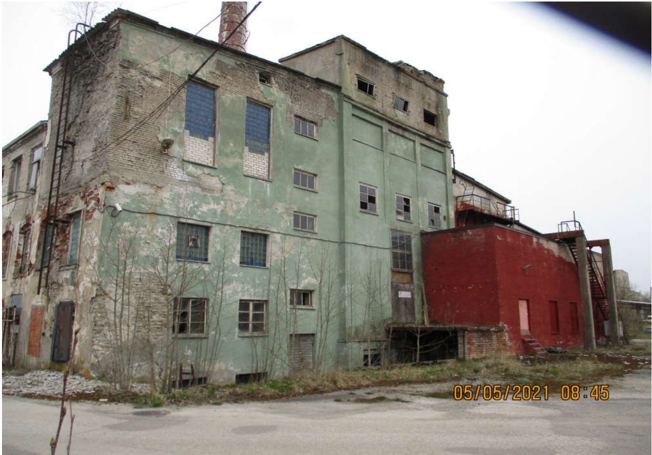
Foto 1. Katlamaja hoone idafassaad koos sissepääsuga ruumi IV