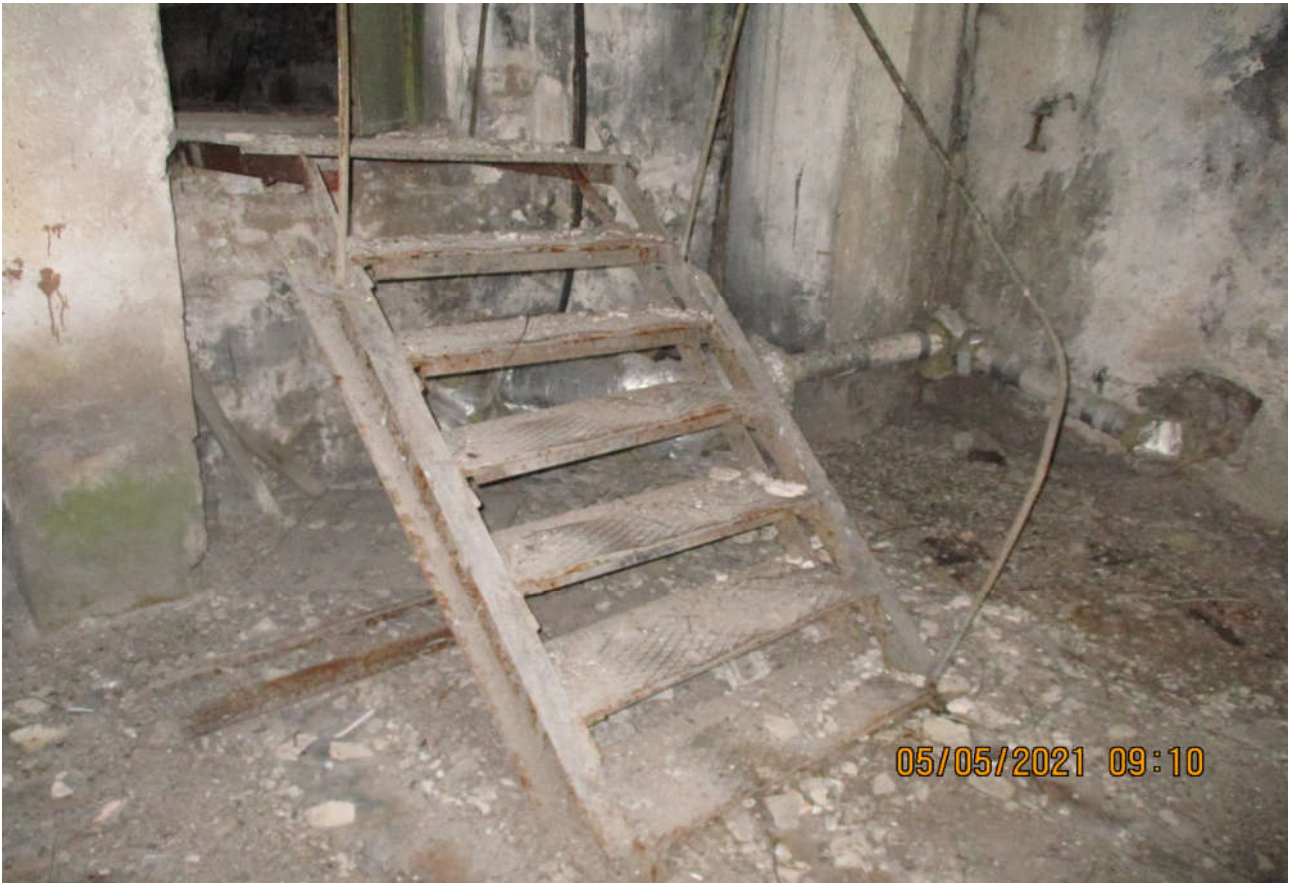
Foto 7. Ruum IV pääs ruumi V koos trepiga