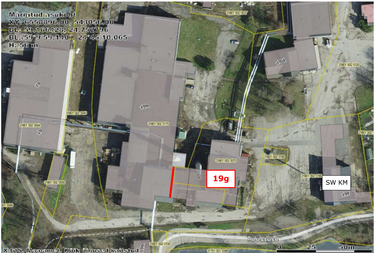
Kohila Paberivabriku territooriumi plaan; punasega on vana katlamaja hoone 19g