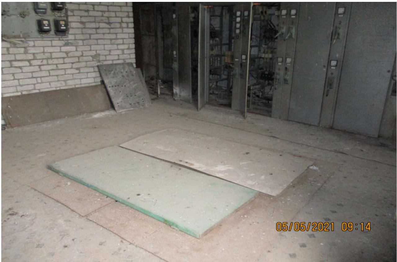
Foto 10. Ruumi V kunagine elektrijaotla osa koos põrandaavausega