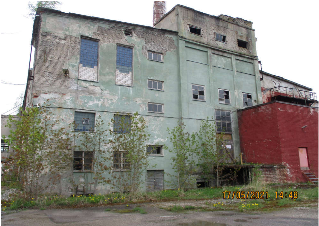
Foto 11. Katlamaja hoone idafassaad koos sissepääsuga ruumi IV