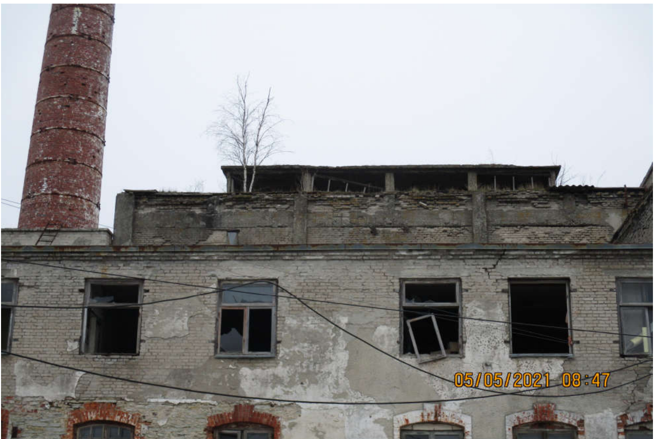
Foto 6. Katlamaja hoone lõunafassaad koos ülal ruumi IV katuseakende kõrgendusega