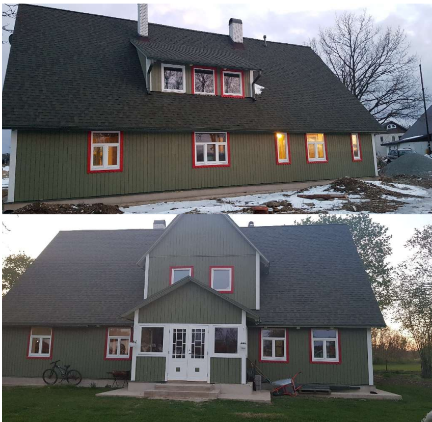
Fotodel - olemasolev eluhoone.