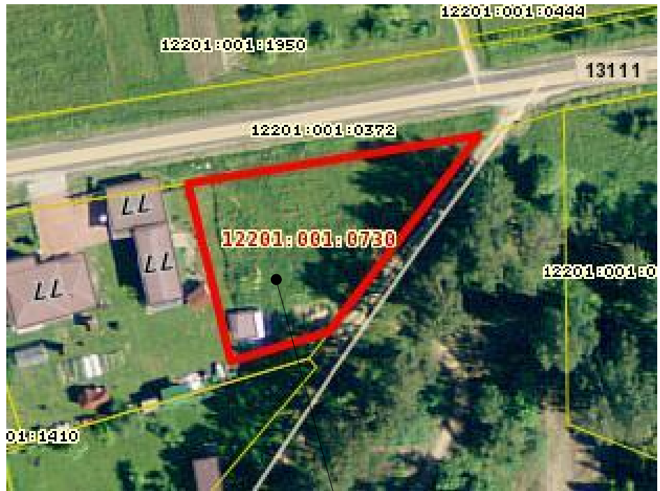
Alajõe valla, Katase küla, Rannasalu tee 75