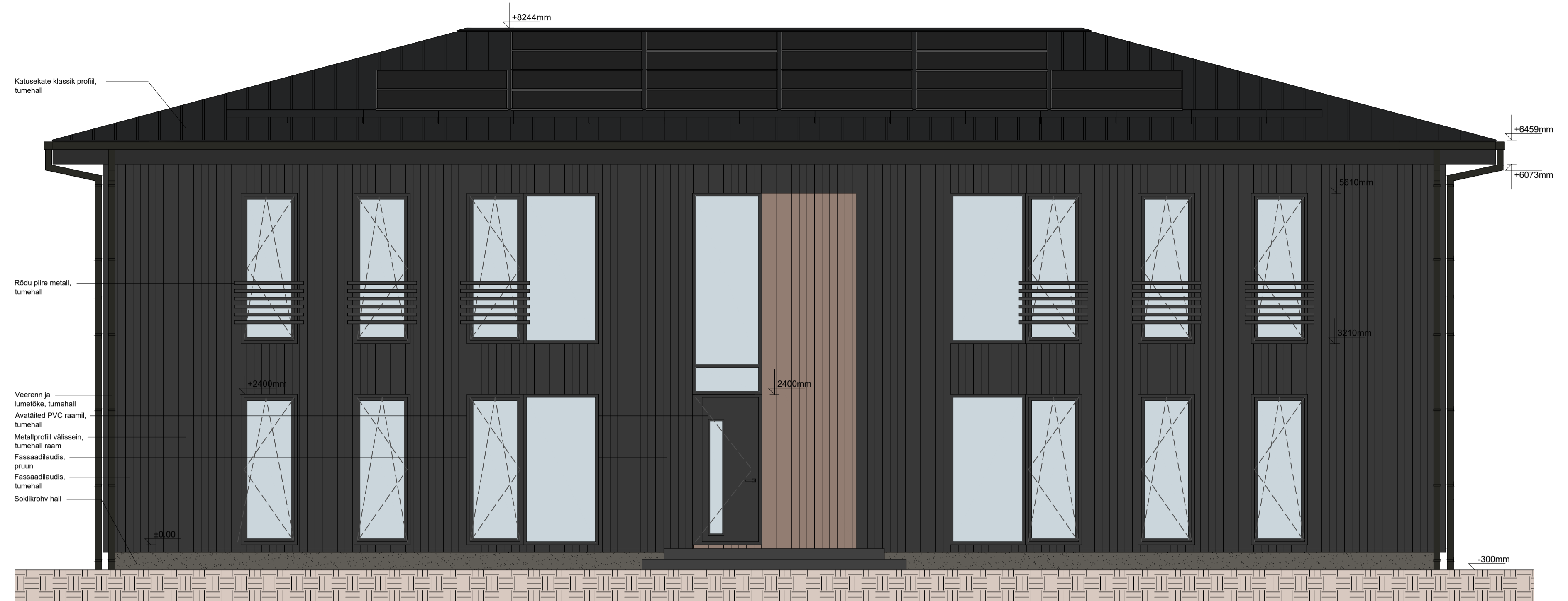
Vaade eest Mõõtkava 1:50